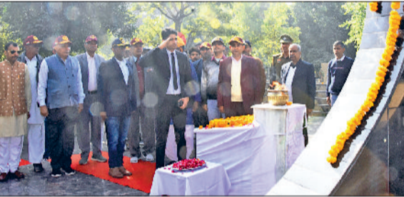
भिवानी। विजय दिवस पर शहीद स्मारक पर पुष्प अर्पित करते हुए।