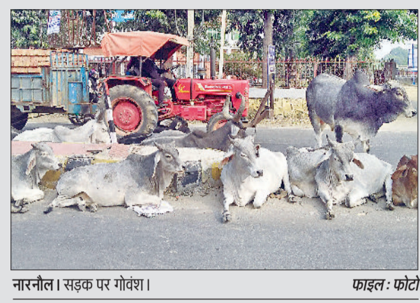
नारनौल। सड़क पर गोवंश।

उन्होंने बताया कि जिले में एक मॉनिटरिंग कमेटी का गठन कर दिया गया है। यह कमेटी विभिन्न सार्वजनिक स्थल तथा अधिक भीड़भाड़ वाले क्षेत्रों पर इस संबंध में कड़ी नजर रखेगी। इसमें विभिन्न विभागों के अधिकारी शामिल हैं। सीएमओ हॉस्पिटल में यह सुनिश्चित करने कि वहां पर आवारा कुत्ते ना घूमें। जीएम रोडवेज बस स्टैंड में यह सुनिश्चित करने तथा इसी प्रकार रेलवे विभाग के अधिकारी भी इस संबंध में कड़ी नजर रखेंगे। उन्होंने बताया कि जिला स्तर पर एक संयुक्त कार्य बल का गठन किया गया है। इसमें राष्ट्रीय राजमार्ग प्राधिकरण, लोक निर्माण विभाग, पशुपालन, पुलिस, विकास एवं पंचायत विभाग के प्रतिनिधि शामिल हैं। उन्होंने मुख्य मार्गों और राजमार्गों पर चौबीसों घंटे गश्त सुनिश्चित करने तथा बेसहारा पशुओं को हटाकर सुरक्षित स्थानों पर पहुंचाने के निर्देश दिए। उन्होंने स्पष्ट किया कि शहरी क्षेत्रों में नगर निकाय व ग्रामीण क्षेत्रों में पंचायत विभाग इन पशुओं को पकड़ने और चिह्नित गोशालाओं तक पहुंचाने के लिए उत्तरदायी होंगे। उन्होंने कहा कि सार्वजनिक स्थानों पर चौबीसों घंटे चलने वाले सहयता केंद्र संख्या हेलपलाइन 9306001570, 9416248495, 8307113197, 9467859544 व 01285225298 पर नागरिक अपनी शिकायतें दर्ज कर सकते हैं।