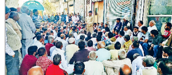
भिवानी। चोरी की घटना होने पर कस्बे के पंचायत करते व्यापारी।