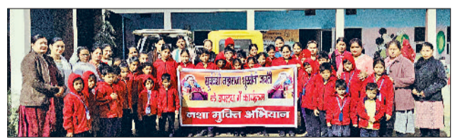
भिवानी। जागरूकता रैली निकालते विद्यार्थी व शिक्षक।

ढोबी तालाब के पास महाराजा शूरसैनी जयंती पर मेगा माईड स्कूल के बच्चों ने नशा मुक्ति हरियाणा जागरूकता अभियान का आयोजन किया। अभियान श्रीसैनी धर्मार्थ धर्मशाला एवं नवदुर्गा सेवा सहयोग संस्था के संयुक्त तत्वावधान में संपन्न हुआ। कार्यक्रम का मुख्य उद्देश्य समाज को नशे के दुष्परिणामों से अवगत