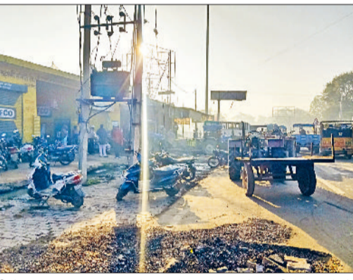
बवानीखेड़ा। नागरिक अस्पताल के सामने कॉर्पोरेटिव सोसायटी के सामने रोड़ पर जमा किसानों के वाहनों की भीड़ तथा भिवानी में पैस के लिए ट्रैकों में खाद लोड करते मजदूर।

किसानों के लिए यूरिया खाद दिन प्रतिदिन टेंशन का कारण बनती जा रही है। जरूरत के हिसाब से यूरिया खाद लेने के लिए किसान अल सुबह ही पैस के आगे लाइनों में खड़े हो रहे हैं। घंटों लाइनों में खड़े होने के बावजूद भी उनको खाद नहीं मिल पा रही है। दूसरी तरफ मंगलवार को बवानीखेड़ा प्लाईग पर यूरिया खाद की एक गाड़ी पहुंची। खाद पाने के लिए किसान अल सुबह ही अपने वाहनों को लेकर लाइनों में खड़े हो गए। एक बारगी तो किसानों के वाहनों की वजह से सामान्य अस्पताल के समक्ष जाम की स्थिति बन गई। जिस वजह से बवानीखेड़ा कस्बे के बीचोंबीच गुजरने वाला रोड बनने लगे गया।